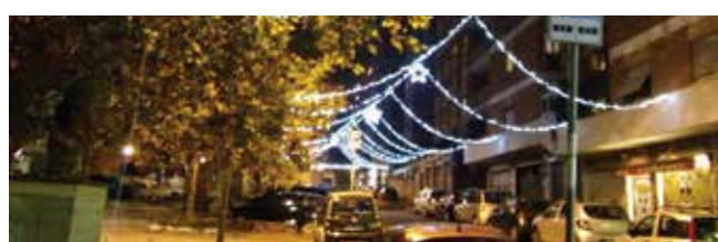
Via Monte Cervialto: fili luminosi e stelle centrali