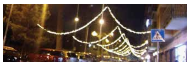
Via Capuana: in continuità con via Ojetti, stessi fili luminosi