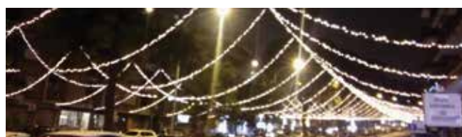
Via Ugo Ojetti: decorazione simile a quella di via monte Cervialto ma senza la stella centrale