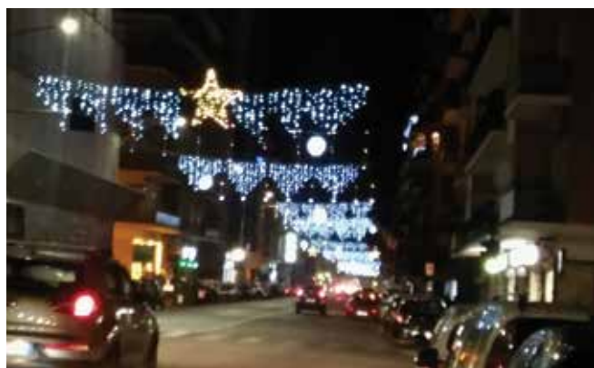
Via Conca d'Oro: i negozianti hanno scelto una decorazione con palle e stelle, sostituendo le mezzelune iniziali. A pagina 9 potete leggere il perché di questo cambiamento.